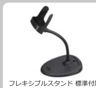
フレキシブルスタンド 標準付属

Voyager 1450g は、全方向読み取りの1次元スキャナです。本製品の導入後でも、デコーダーライセンス契約(オプション)により、2次元スキャナとしてアップグレードすることが可能です。また、最新の小型エンジンを搭載した Voyager 1450g は、バーコードの方向を気にすることなく 360°全方向よりバーコードの読み取りが可能です。さらに、高さの無いバーコードでも、CCD タッチスキャナやレーザースキャナと違い、エイマーを照射するだけで容易に読み取れることも特長です。ローコストで導入可能な上、ダメージバーコードの読み取りにも優れ、さらに携帯電話等の液晶画面に表示されたバーコードや QR コードなどの読み取りも可能です。